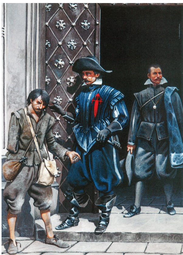
Desamparo del soldado del “Tercio” cuando alcanzaba su retiro