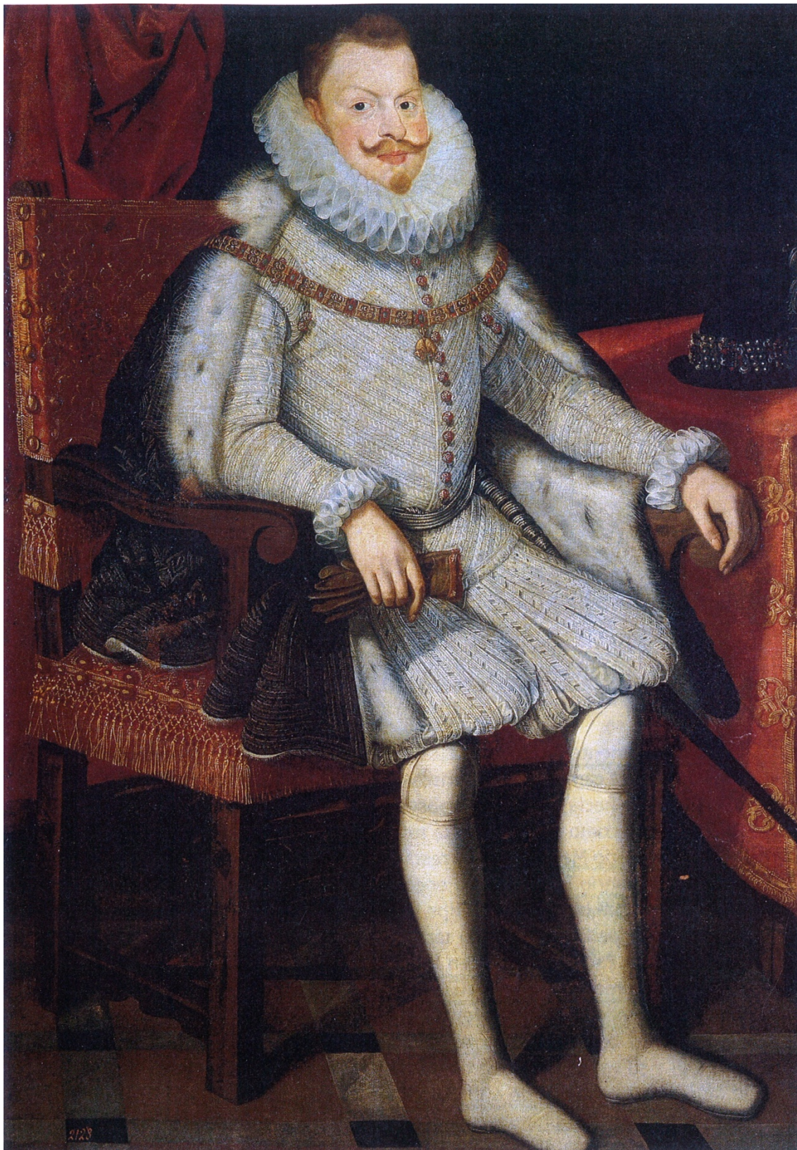
Felipe III el "Piadoso" (1598-1621)