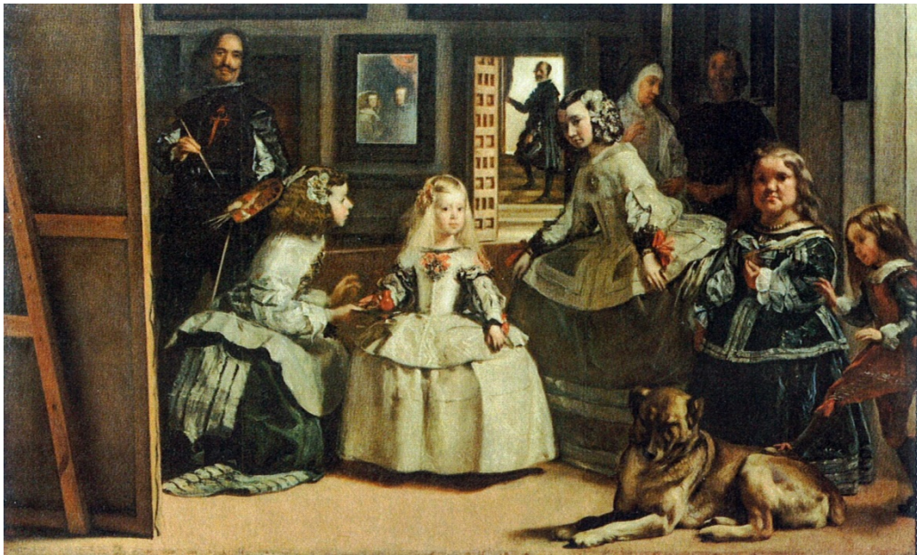
Las Meninas (la familia de Felipe IV) obra maestra de Velázquez. El pintor más genial del “Siglo de Oro” español.