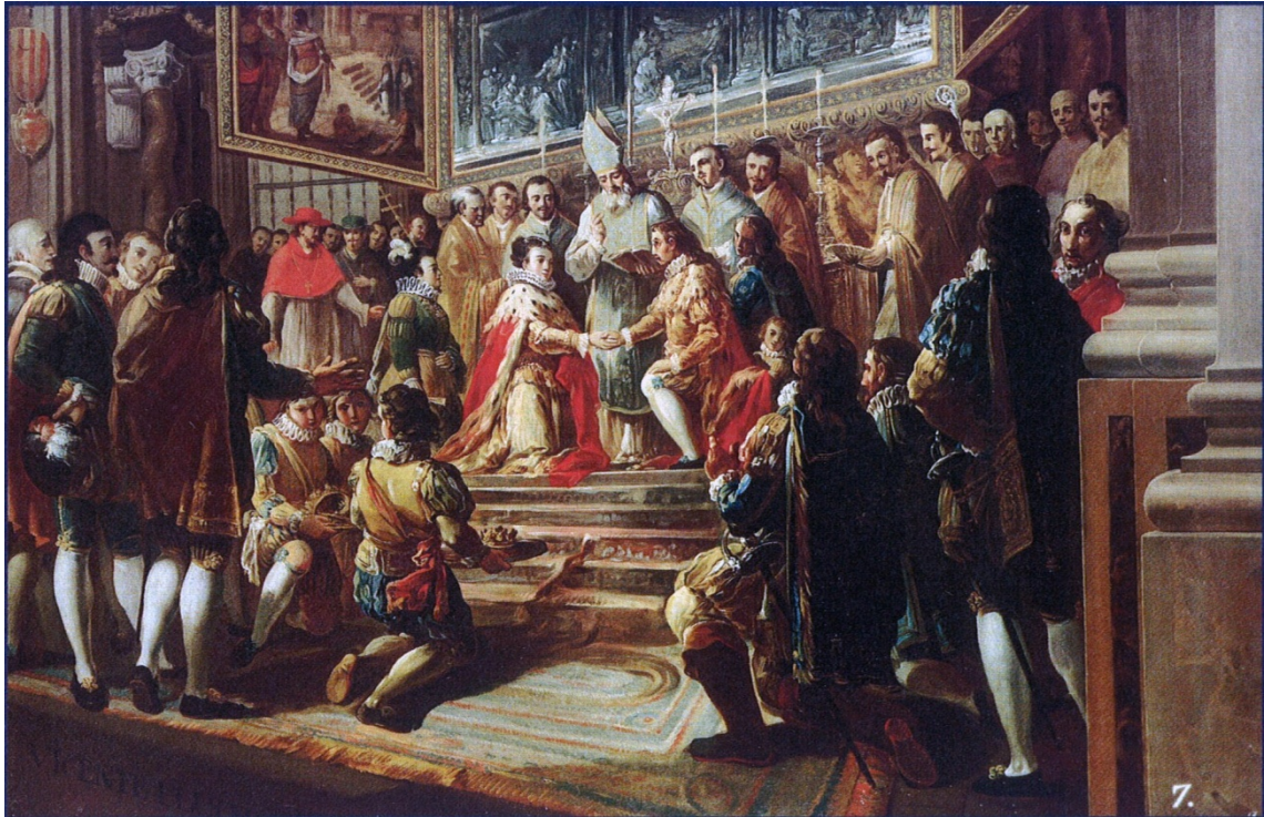
Matrimonio de Felipe III y Margarita de Austria en la Catedral de Valencia