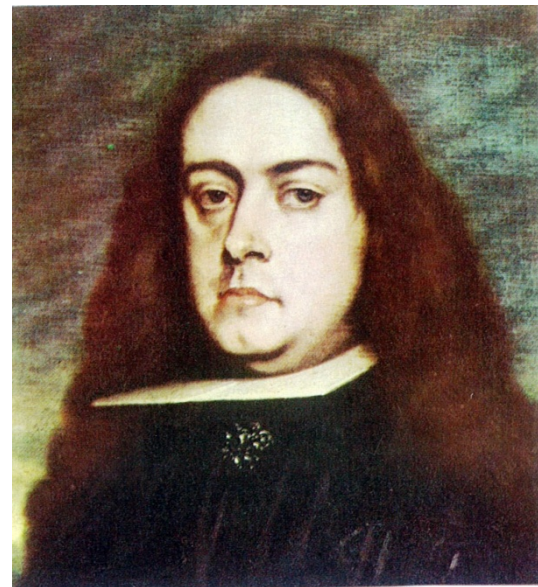
Duque de Medinaceli. Valido de Mariana de Austria, madre y regente de Carlos II