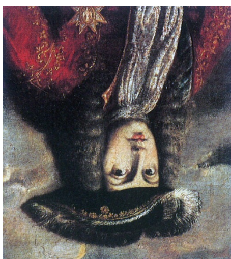
Uno de los símbolos emblemáticos de todos los males que sufrió el Reino de Valencia, después de la Batalla de Almansa, es este retrato invertido de Felipe V conservado en el Museo de Játiva