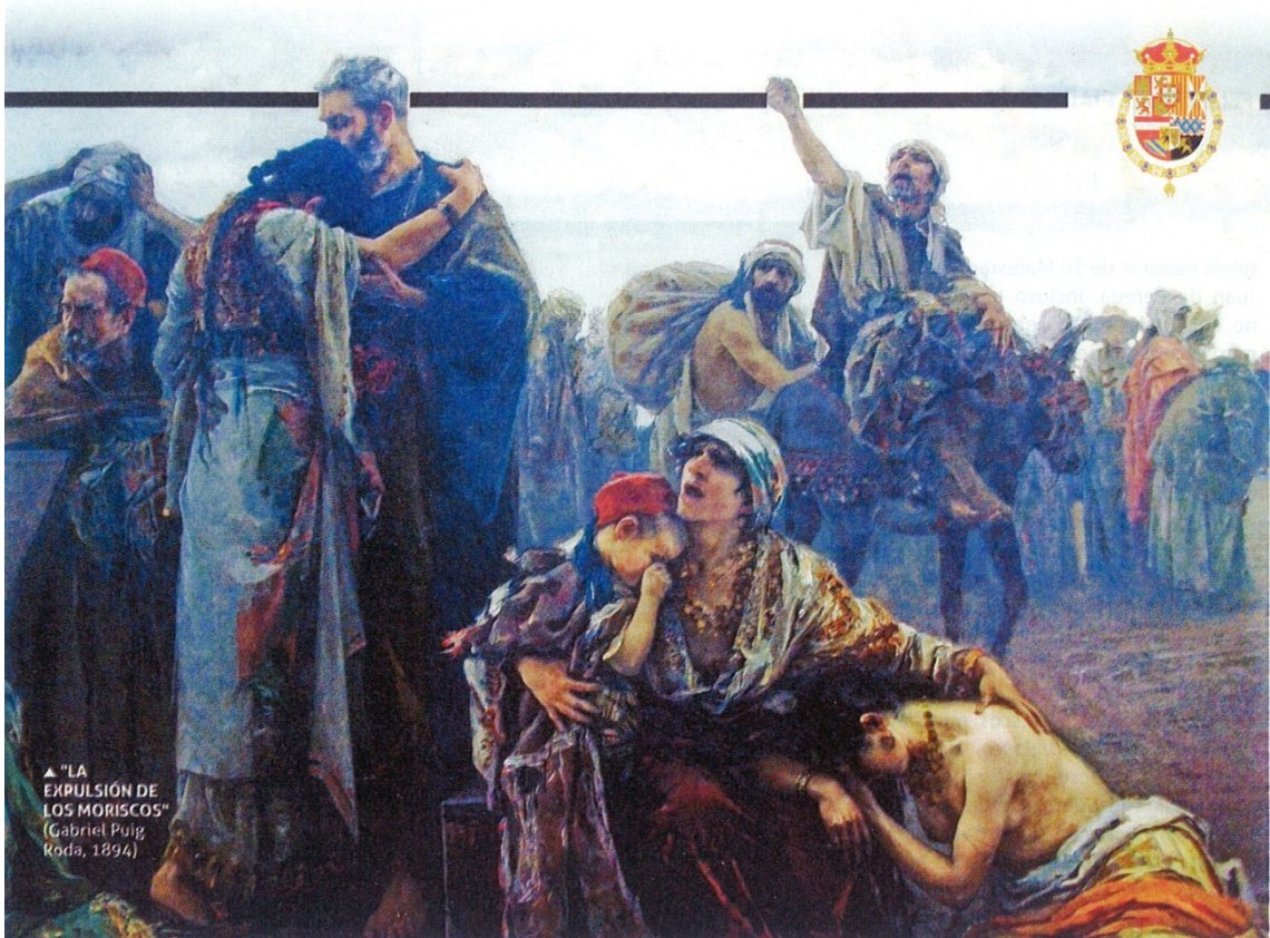
La expulsión de los moriscos. Triste despedida antes de su embarque.