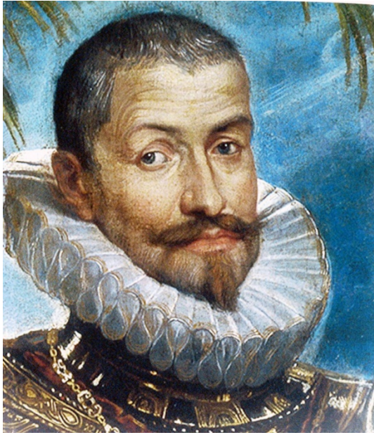
El Duque de Lerma. Valido de Felipe III