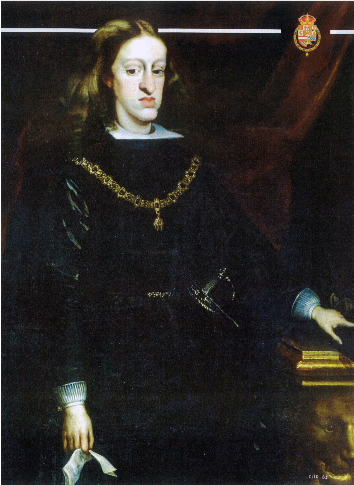
Carlos II el "Hechizado" (1665-1700)