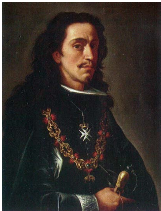
Juan José de Austria. Hermano natural y valido de Carlos II