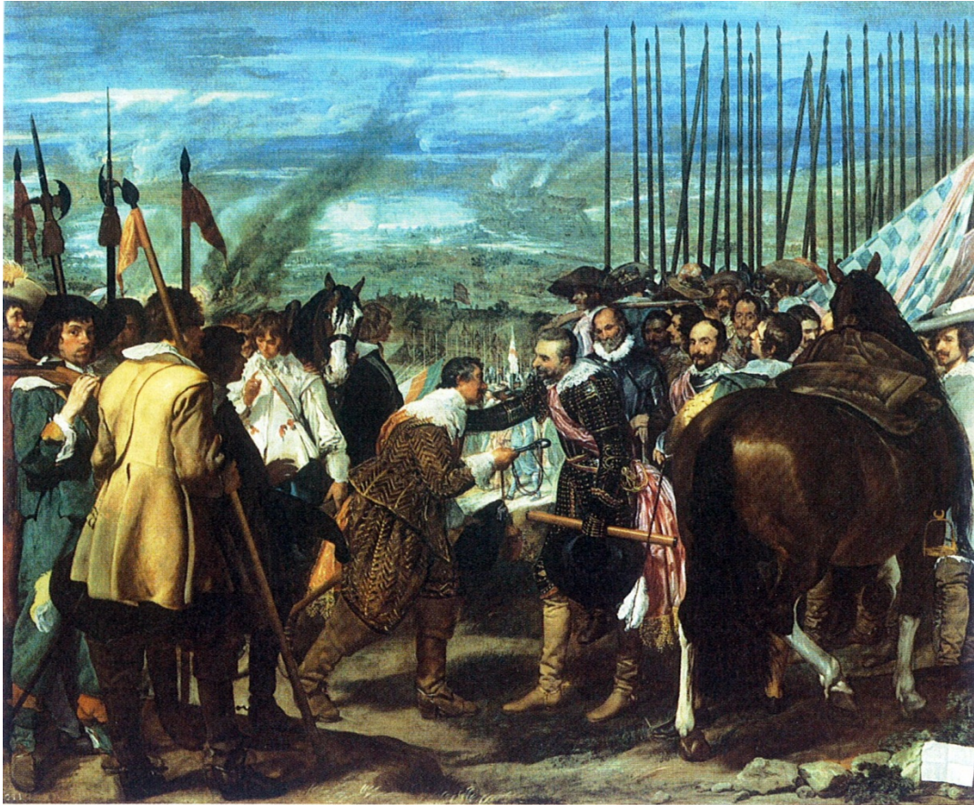
Rendición de Breda o Las Lanzas de Velázquez