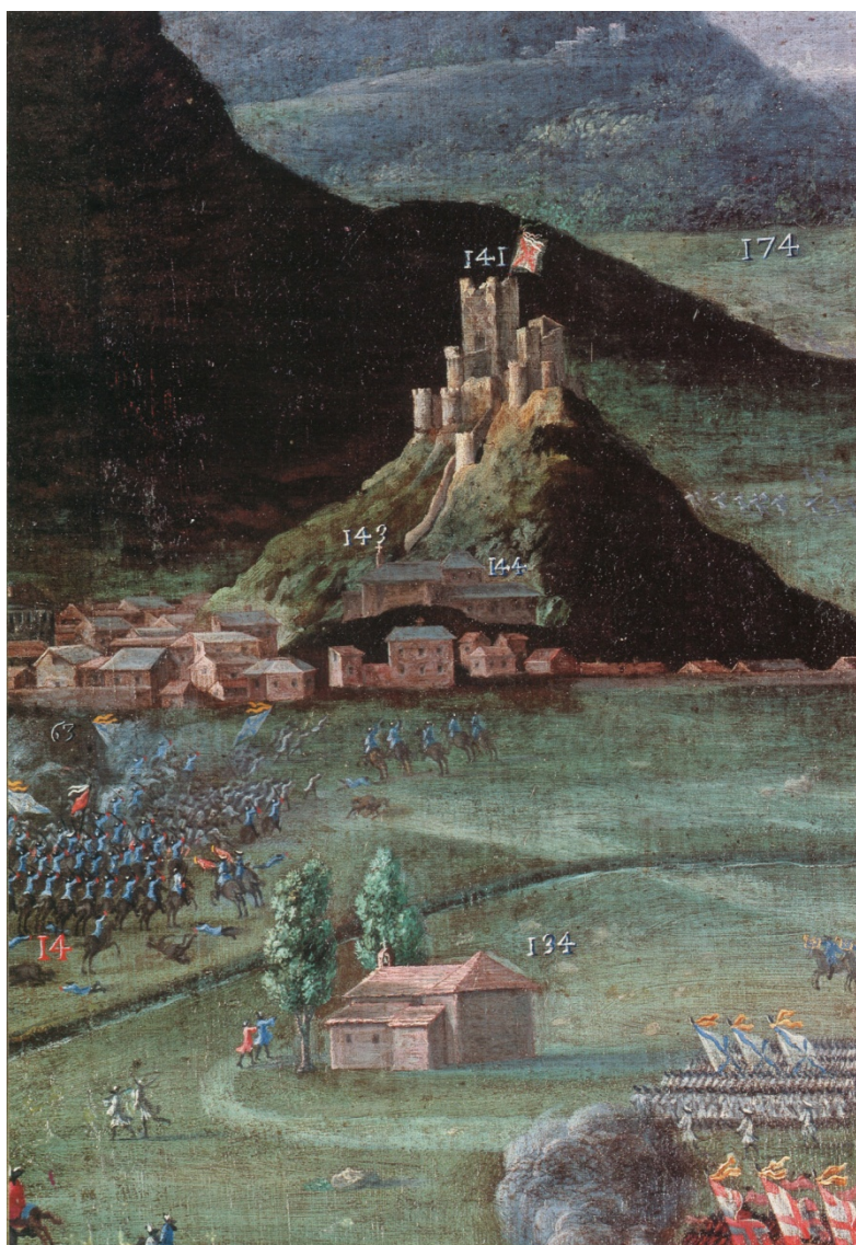
Detalle de la Batalla de Almansa, en la que participaron más de 50.000 hombres y que fue la más sangrienta de la Guerra de Sucesión