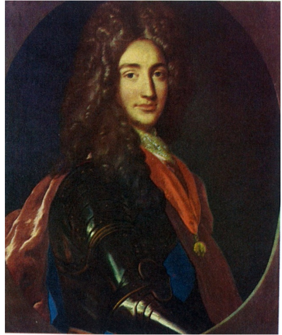
Duque de Berwick. General borbón, vencedor de la Batalla de Almansa