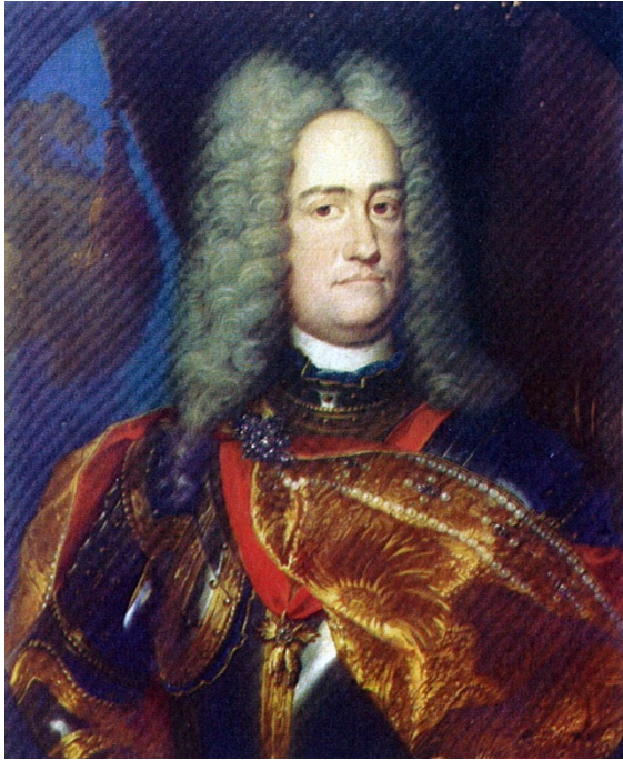
El Archiduque Carlos. Candidato y beligerante en la Guerra de Sucesión Española