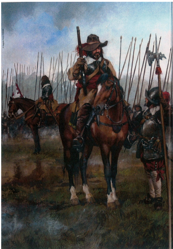
Arcabucero de los “Tercios Españoles” S. XVII