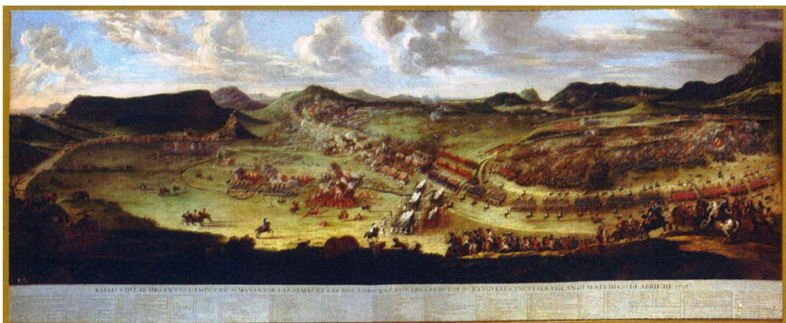
Batalla de Almansa